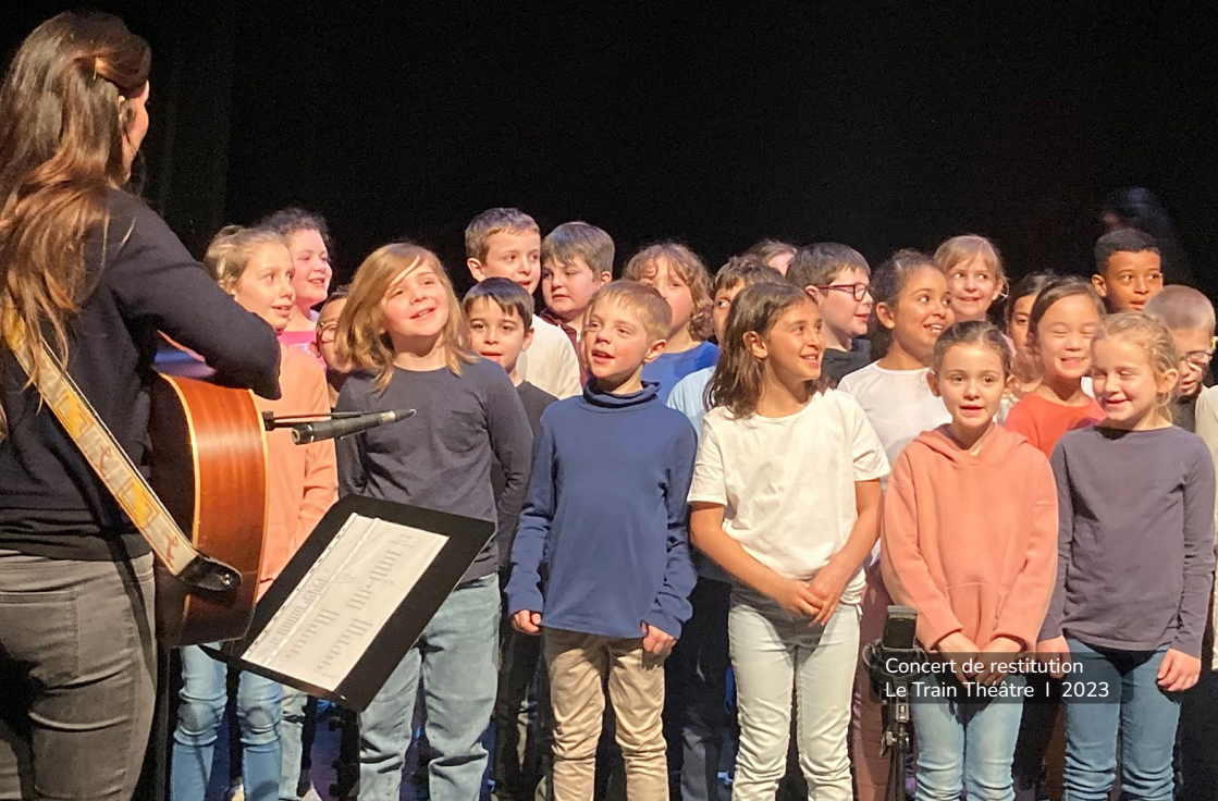
Concert de restitution Le Train Théâtre | 2023

À l'école, il inscrit son action sur le long terme et travaille en co-construction avec les professeurs des écoles sur le projet musical de l'année.